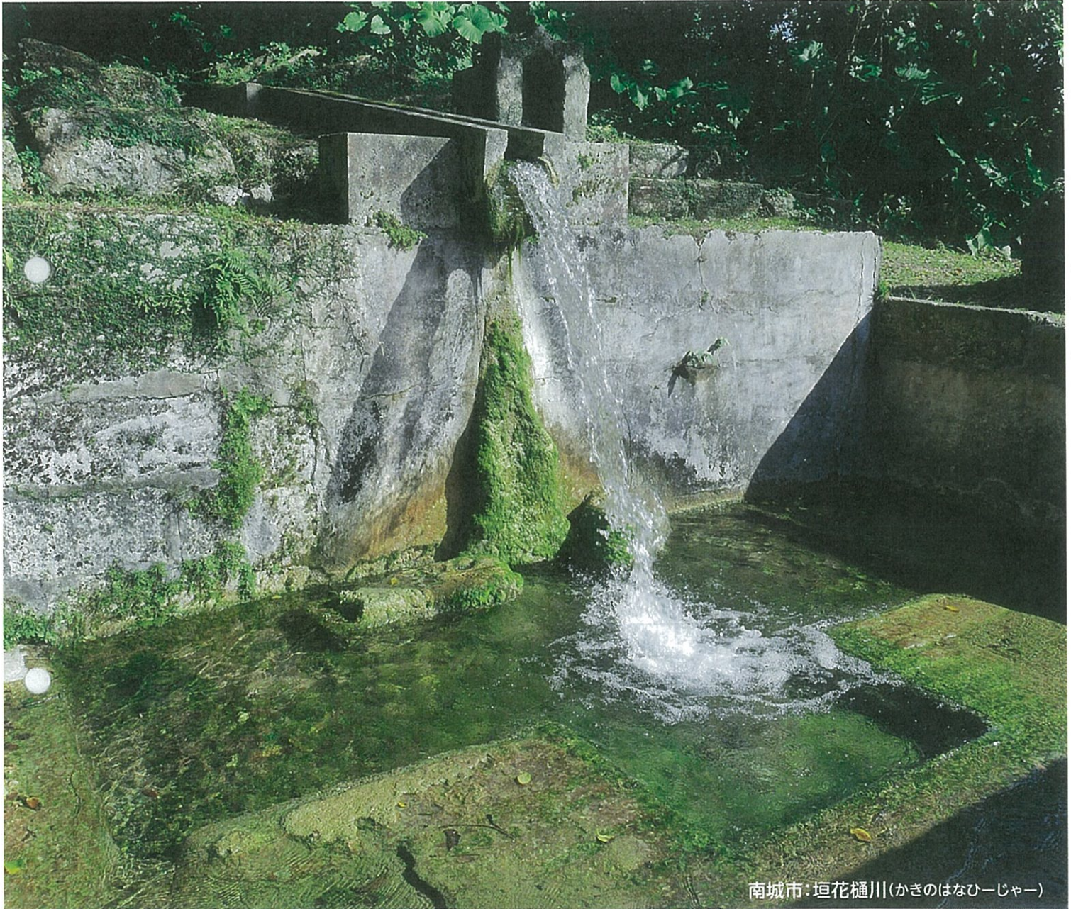
南城市:垣花樋川(かきのはなひーじゃー)